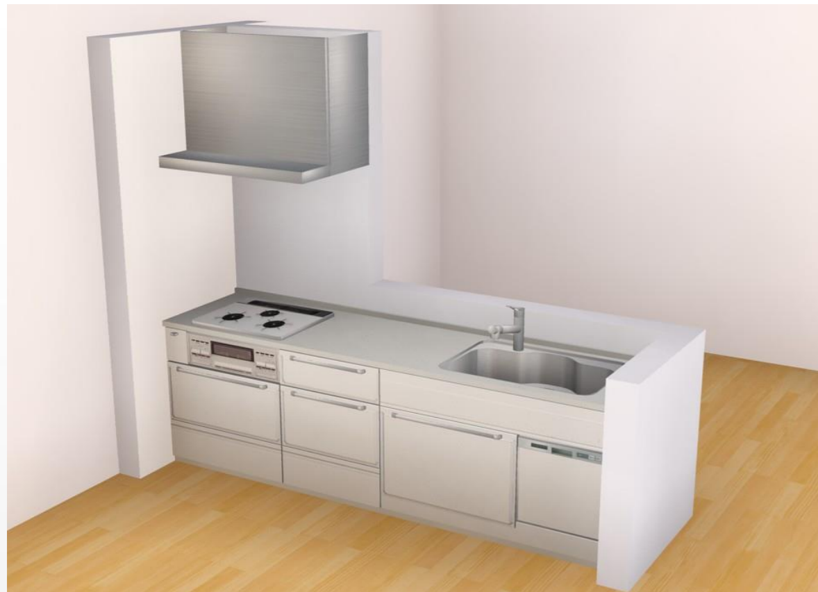
画像はイメージです。